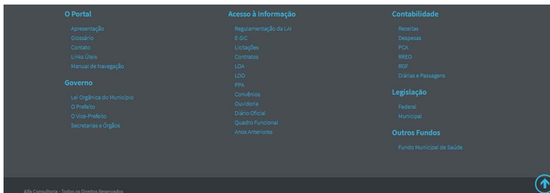
Figura 7 - Rodapé

No rodapé do portal é disponibilizado o mapa do site, com todos os menus, acesso e todos os itens das seções contabilidade e acesso à informação.