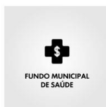
Figura 6 - Seção outros fundos