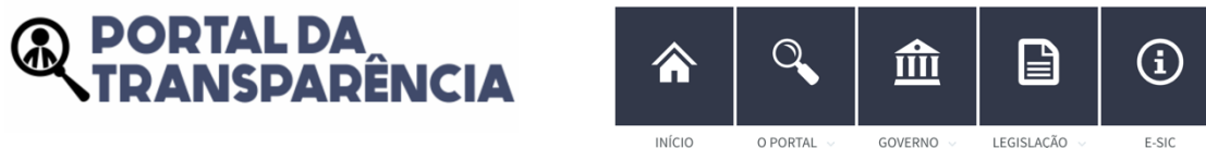
Figura 3 - Menu principal