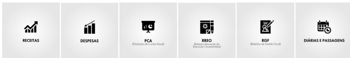
Figura 4 - Seção contabilidade