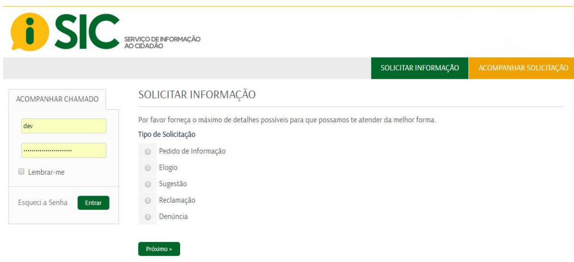
Figura 9 - Detalhes da solicitação

Os dados de acesso são: o e-mail informado, e a senha é o número de protocolo informado pelo sistema no fim do processo. Caso o cidadão não informe um e-mail, ele poderá entrar em contato por telefone ou presencialmente com o ente, informar o protocolo e o servidor responsável informará o status do atendimento.