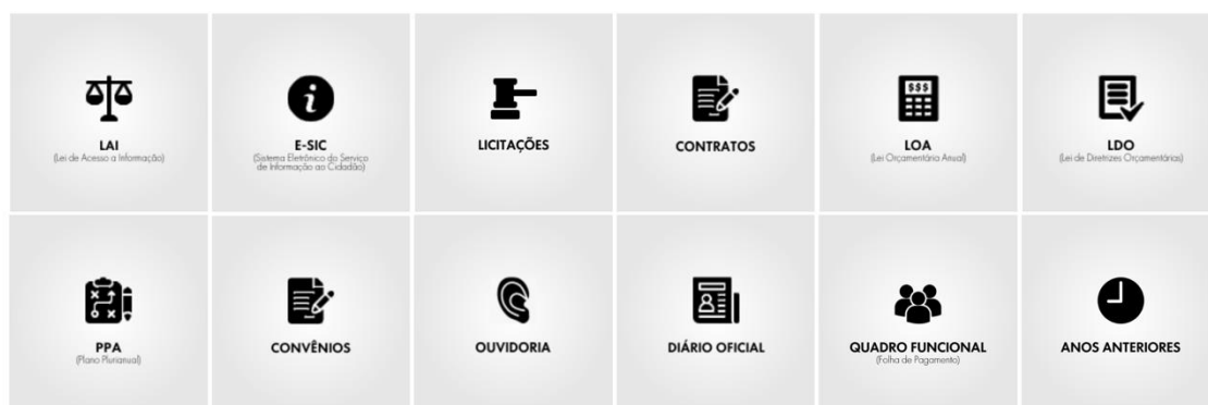
Figura 5 - Seção Acesso à informação