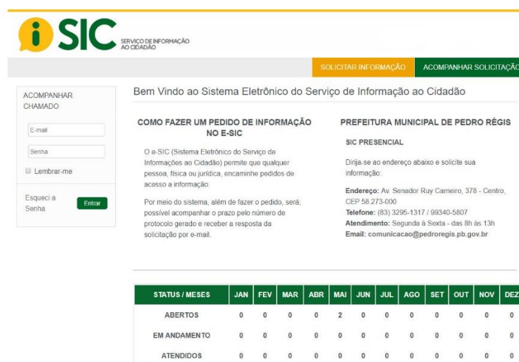
Figura 8 - Página principal sistema e-SIC

Na página principal do e-SIC, além de poder solicitar e acompanhar uma solicitação, o cidadão pode verificar o Relatório Estatístico , com os quantitativos de solicitações feitas